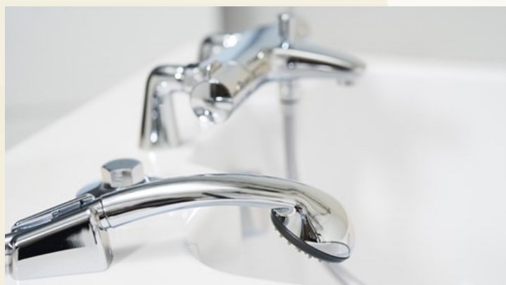
Thermostatmischer 1/2" mit Verbrühschutz

Platz für alle gängigen Liftersysteme. Die Stationswanne ist durch Ihre Bauart schnell aufgestellt und kann leicht installiert werden.