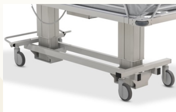
Sicherheitsfahrgestell, unterfahrbar, mit 4 Bremsrollen