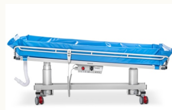
Neigungsverstellung +/- 4 Grad, Trendelen-Position