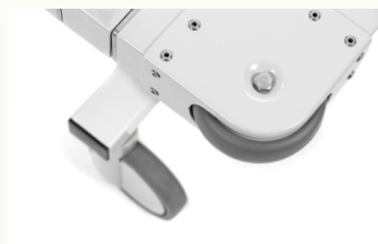
Liegefläche mit 4 Stossrollen, Seitengitter abklappbar