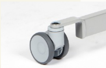
Leichtlaufrollen D=100 mm