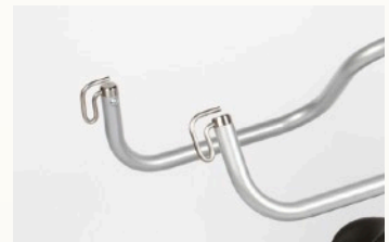
Gurtaufnahme für Schlaufengurte