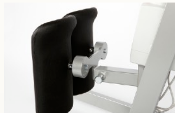
Kniestütze gepolstert, in der Tiefe verstellbar