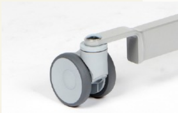
Leichtlaufrollen D=100 mm