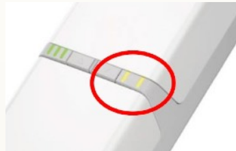
Anzeige des Wartungsintervalls