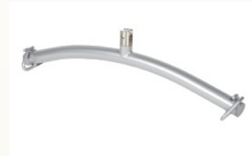
Gurtaufnahme für Schlaufengurte