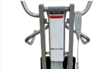
Steuerbox mit Wechselakku und Kabelhandbedienung